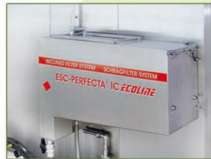
Integrierter Schrägfilter Integrated inclined filter system